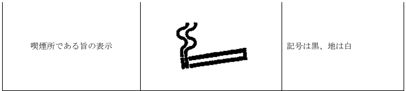
別表第3（第61条、第62条、第63条、第99条関係）