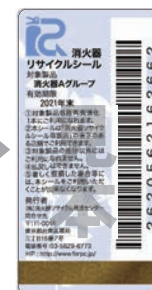
新品用シール(見本)

製品にはリサイクルシールが貼られています。耐用年数を過ぎたら、取扱い窓口へ引き渡してください。