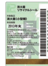
既製品用シール(見本)